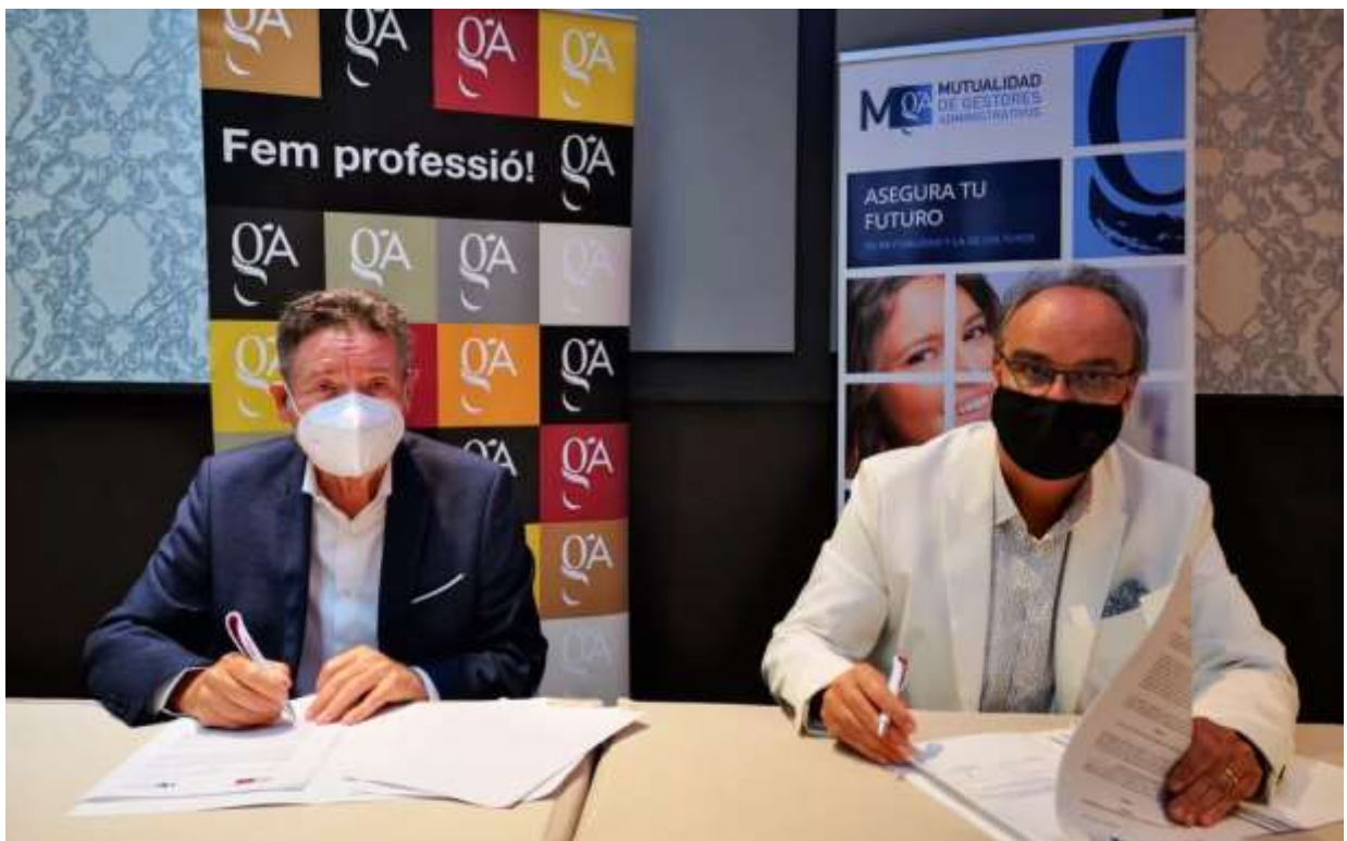
Firma del convenio de colaboración con el Colegio de Cataluña