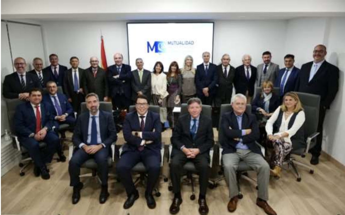
Firma del convenio de colaboración con el Colegio de Sevilla

Hemos destinado un gran esfuerzo a las Relaciones Institucionales, conscientes de su importancia, principalmente en el ámbito de la profesión de Gestor Administrativo, así como con otras instituciones del mutualismo alternativo.